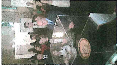
9) Inauguración de la exposición temporal por parte del Ministro de Cultura y Deportes.

RESULTADOS OBTENIDOS: se hace la exposición "Recuperando la historia de nuestro pasado" con 30 piezas repatriadas de Estado Unidos, El Salvador, Honduras, España, Italia, Suiza y Alemania.