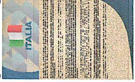
6) Creación de los artes de los paneles interpretativos por piezas repatriadas según el país.