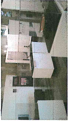
8) Montaje final de las piezas arqueológicas con sus fichas que las identifica.