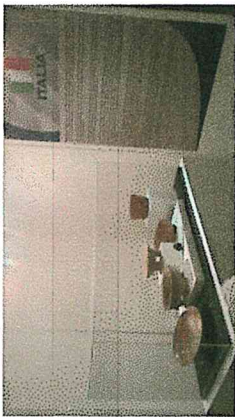
7) Montaje final por país repatriado.