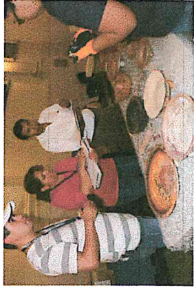
3) Recepción de las piezas arqueológicas por parte del personal del palacio.