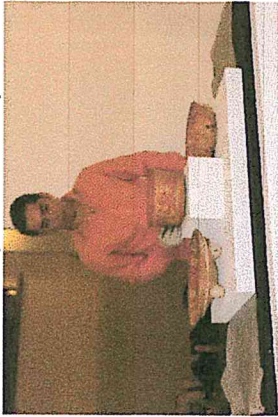
5) Composición de las piezas arqueológicas en sus plintos y bases según el guión museográfico.