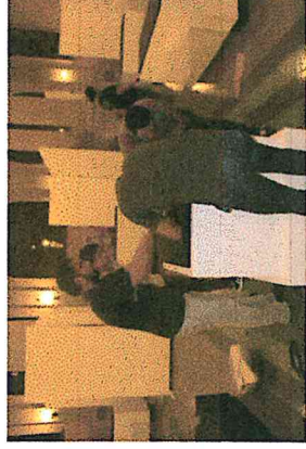
4) Montaje de los plintos y bases según el guión museográfico planteado.